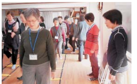
3/19 ボランティア慰労会