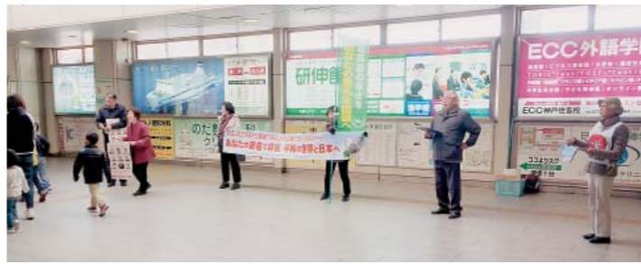
3/27 JR住吉駅改札前で宣伝署名行動

議会(日本原水協)は、いくつもの全国的な集中行動を提起しています。私たちもこの署名を今後の重点課題としてとりくみます。3月27日はいつせい駅頭宣伝の日。JR住吉駅改札前に社保委員を中心に11人が集まり、午後4時から約1時間の行動で36筆の署名が集まりました。